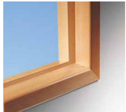
För 12 mm brandskyddsglas. Brand-/ljudklass E 30/30 dB.