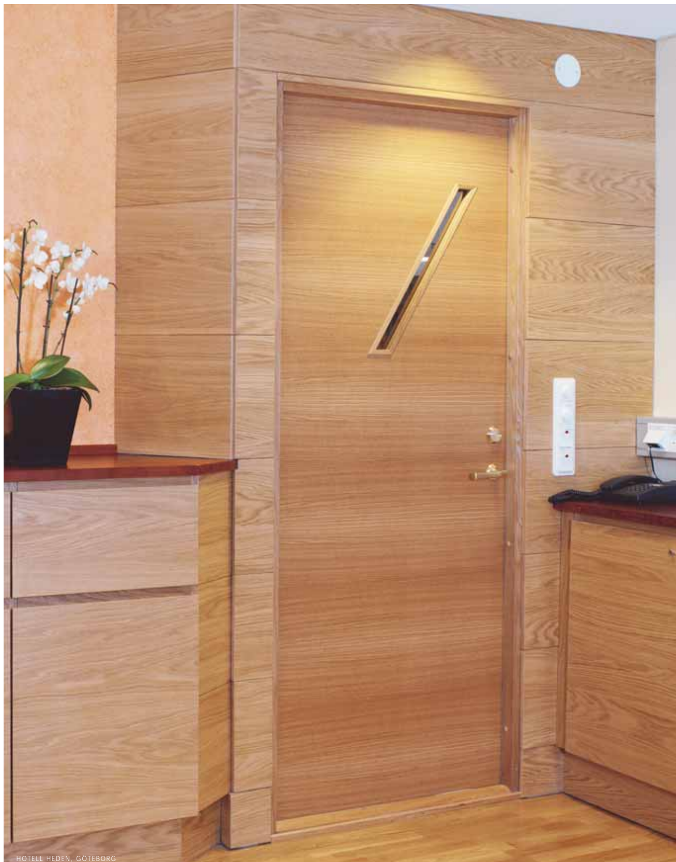
HOTELL HEDEN, GÖTEBORG

Speciallösningar är Orresta Dörrens signum. I samarbete med arkitekter och inredare tar vi fram förslag på dörrar med glasöppningar i olika specialutförande. Vi kan tillgodose de flesta önskemål om form, storlek, ramar och olika tillbehör och detaljer. Vår långa erfarenhet gör att vi kan bidra med många infallsvinklar i det gemensamma uppdraget.