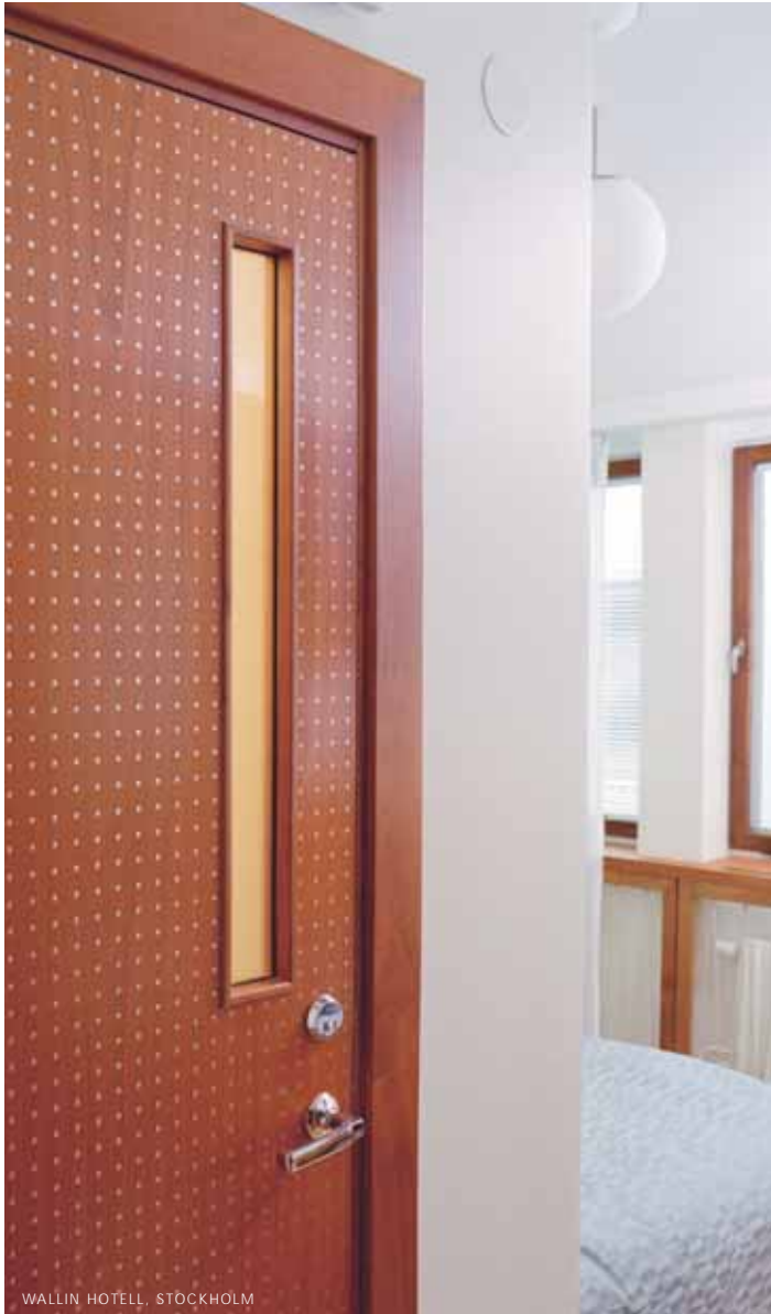
WALLIN HOTELL, STOCKHOLM