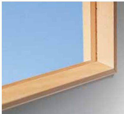
För 4-6 mm glas. Ljudklass max 25 dB.