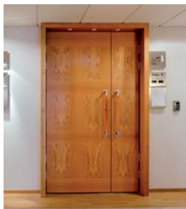
EKSKLUSIVA FANERADE TRÄDÖRRAR

Orresta är specialiserat på exklusivt fanerade trädörrar och glasparterier i trä. Orresta är en medelstor dörrtillverkare med hög flexibilitet. Vilket ger arkitekter och inredare möjlighet att gå vid sidan av standardlösningar på ett kostnadseffektivt sätt samtidigt som man får brand- och ljudklassade produkter.